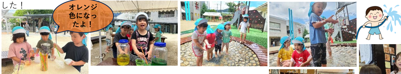
オレンジ 色になっ たよ!

子どもたちがとっても楽しみにしていた水遊びをしました!噴水を出したり、ポンプから水を出すと「きゃー!」と子どもたちは大興奮!! どんどんたまっていく水を足でバシャバシャしたり、お水をかけ合ったりとっても楽しそうでした。色水遊びの方では、コップに色水を注いで混ぜて遊び「オレンジになった!」と色の変化を楽しんでいました。最後にはみんなじゃぶじゃぶ池に入りとっても楽しい時間でした!